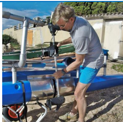
Mise à l'eau