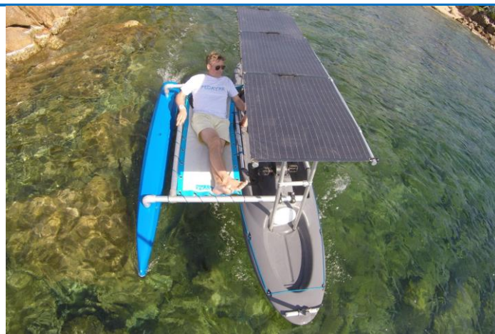
PEDAYAK PRAO SOLAR - R