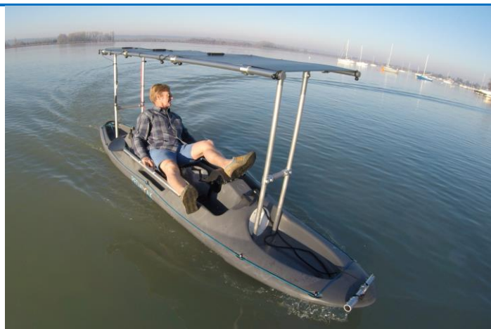
PEDAYAK SOLAR - R